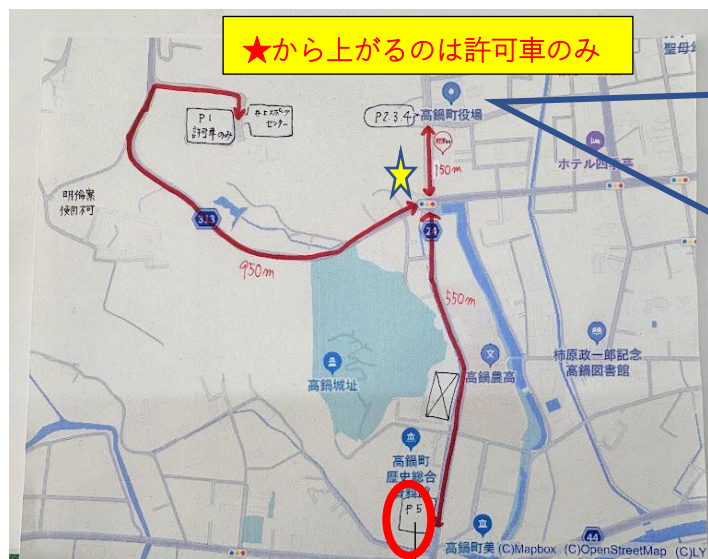
P5：第5駐車場 高鍋城址 南側駐車場

体育館前を「P1」とし、 駐車許可証のある車のみ 乗り入れてください。 送迎のみの生徒等については★交差点より手前で下ろして徒歩で会場に上がってください。 許可証のない車については坂道から上に上がらないようにしてください。 ※バドミントン関係者以外も駐車します。その方々は許可証は持たずに駐車することをご理解ください。