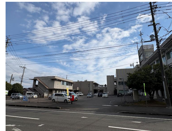
P4：第4駐車場 高鍋町役場東側駐車場